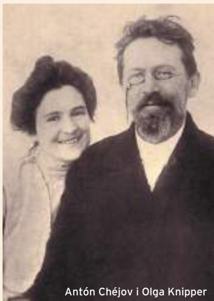
Antón Chéjov i Olga Knipper

Just quan l'espectador corre el risc d'encapritxar-se massa amb un personatge, una situació inesperada s'interposa: res és estable. Chéjov representa als individus i a la societat en estat de canvi perpetu, és el dramaturg del moviment de la vida, alhora somrient i seriós, entretingut i fort.