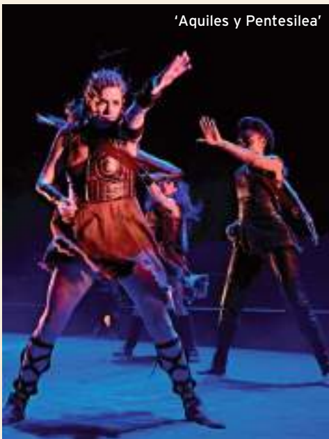
'Aquiles y Penteseilea'

És un dels directors amb major activitat en els últims anys. Creador de la companyia L'OM-Imprebís , amb la qual ha muntat obres de Brecht, Cervantes, Camus o Chéjov