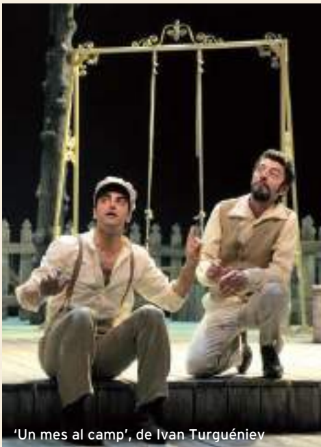
'Un mes al camp', de Ivan Turguéniev

Actor i director de referència en el teatre valencià de les últimes dècades.