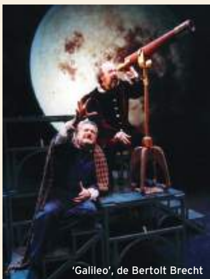
'Galileo', de Bertolt Brecht

L'OM-Imprebís és una companyia teatral espanyola amb una llarga trajectòria, que ha posat en escena un ampli repertori que abasta des dels grans textos de la dramaturgia universal ( Galileo , de Brecht ; Quijote , de Cervantes ; Calígula , de Camus , o Tío Vania , de Chéjov ) fins a espectacles com Els millors sketches de Monty Python o Imprebís , que, estrenat en 1994, es va convertir en l'espectacle d'improvisació pioner a Espanya.