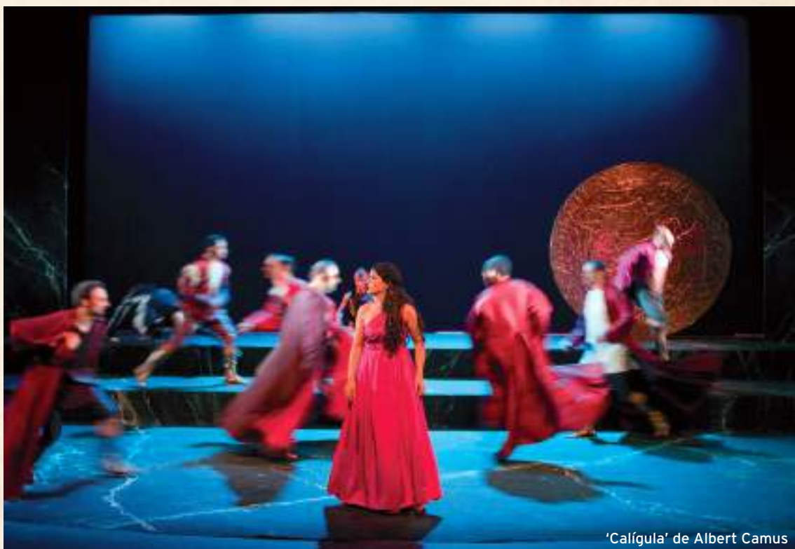
'Calígula' de Albert Camus